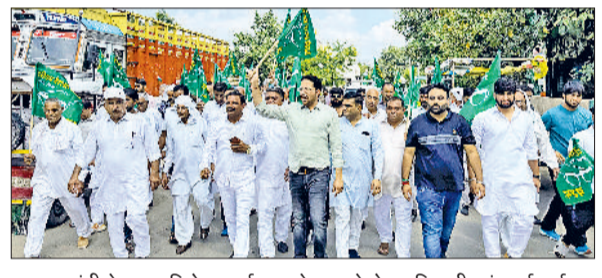
अनाज मंडी के बाहर विरोध प्रदर्शन करते हुए इनेलो पदाधिकारी एवं कार्यकर्ता।