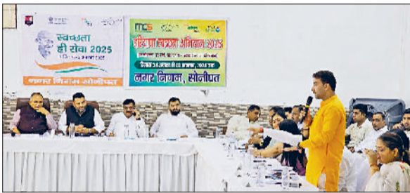
सोनीपत। बैठक में विधायक व मेयर की मौजूदगी में अपनी बात रखते पार्श्व।