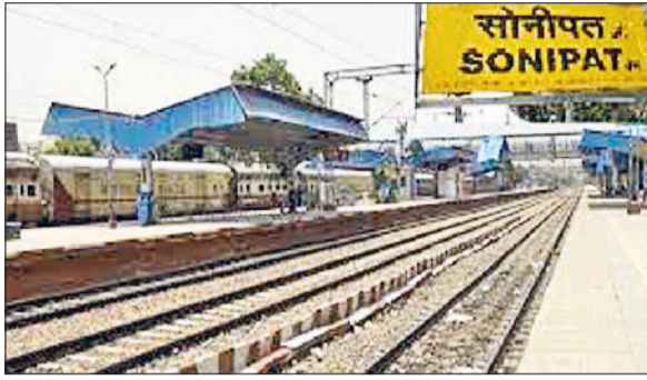
सोनीपत रेलवे स्टेशन

स्ट्रीट लाइट के लिए ढाई करोड़ व सीवर लाइन दबाने लिए भी बैठक में करोड़ों के बजट पर लगी मोहर