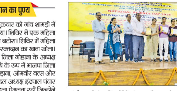
सोनीपत। विजेता विद्यार्थियों को सम्मानित करते हुए।