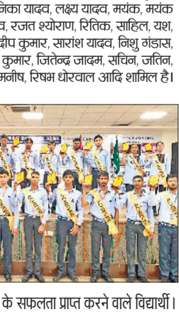
महेंद्रगढ़। आरपीएस स्कूल के सफलता प्राप्त करने वाले विद्यार्थी।