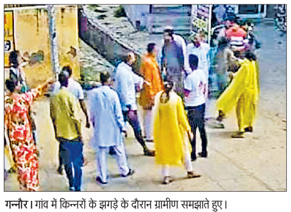
गन्नौर। गांव में किन्नरों के झगड़े के दौरान ग्रामीण समझते हुए।